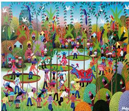
Obra: Bumba-meu-boi, – Artista: Edilson Araújo Data de criação: 2000 – Técnica: Acrílica sobre tela