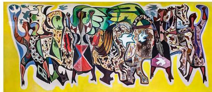
Obra: Bumba Meu Boi – Artista: Di Cavalcanti Data de criação: 1960 – Técnica: Óleo sobre tela

https://enciclopedia.itaucultural.org.br/busca?q=meu+boi+bumba