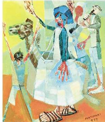
Obra: Bumba-meu-boi – Artista: Candido Portinari Data de criação: 1959 – Técnica: Óleo sobre madeira