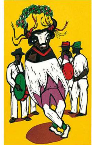
Obra: Bumba-Meu-Boi – Artista: Carlos Scliar Data de criação: 1950 – Técnica: Linoleogravura