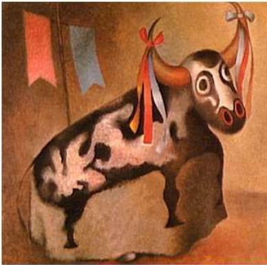
Obra: Boi, do Bumba meu Boi – Artista: Lula Cardoso Ayres Data de criação: 1941 – Técnica: Guache